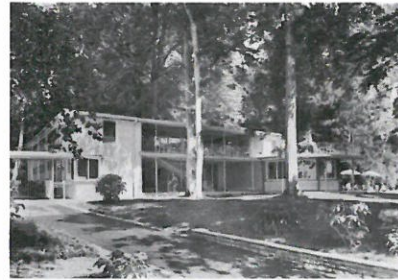
Badestelle Lindenhof in den 60er Jahren

Die Badestelle Lindenhofpark ist ein im westlichen Teil der Parkanlage gelegener Seezugang aus den späten 1950er Jahren. Als einzige seiner Art am bayerischen Bodenseeufer zeugen Gebäude und Anlage von hoher architektonischer Qualität. Zeittypische Merkmale von Leichtigkeit und Beschwingtheit sind hier ausgeführt: sehr schlanke Konstruktionen, zarte Geländer aus Stahl mit eingearbeiteten Motiven (Fische), harmonische Linienführung. Einzigartig sind das hufeisenförmig angelegte Hauptgebäude mit dem baumbestandenen Innenhof, der sich zum See (hin) öffnet, ein halbrunder säulenbestandener Vorbau für die Gastronomie sowie die Seeterrasse im Obergeschoss darüber. Für die Uferanlagen mit Kanzel, Mole und Hafen wurden bestehende bauliche Elemente wie die Mole des ehemaligen Lorenzhafen