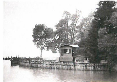
Badehäusle im Westteil des Lindenhofparks, an der ehemaligen „Lorenzstade“, 1886